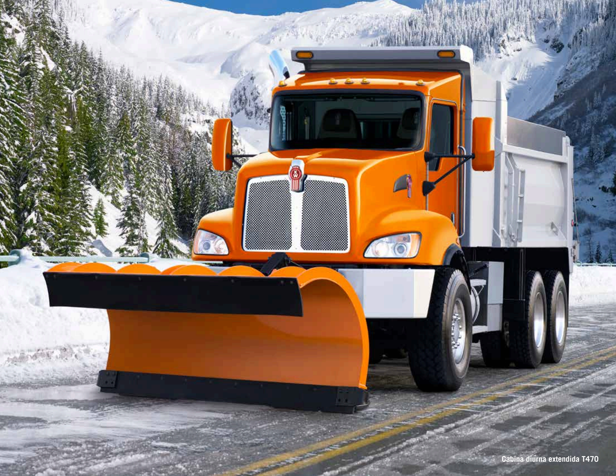
Cabina diurna extendida T470