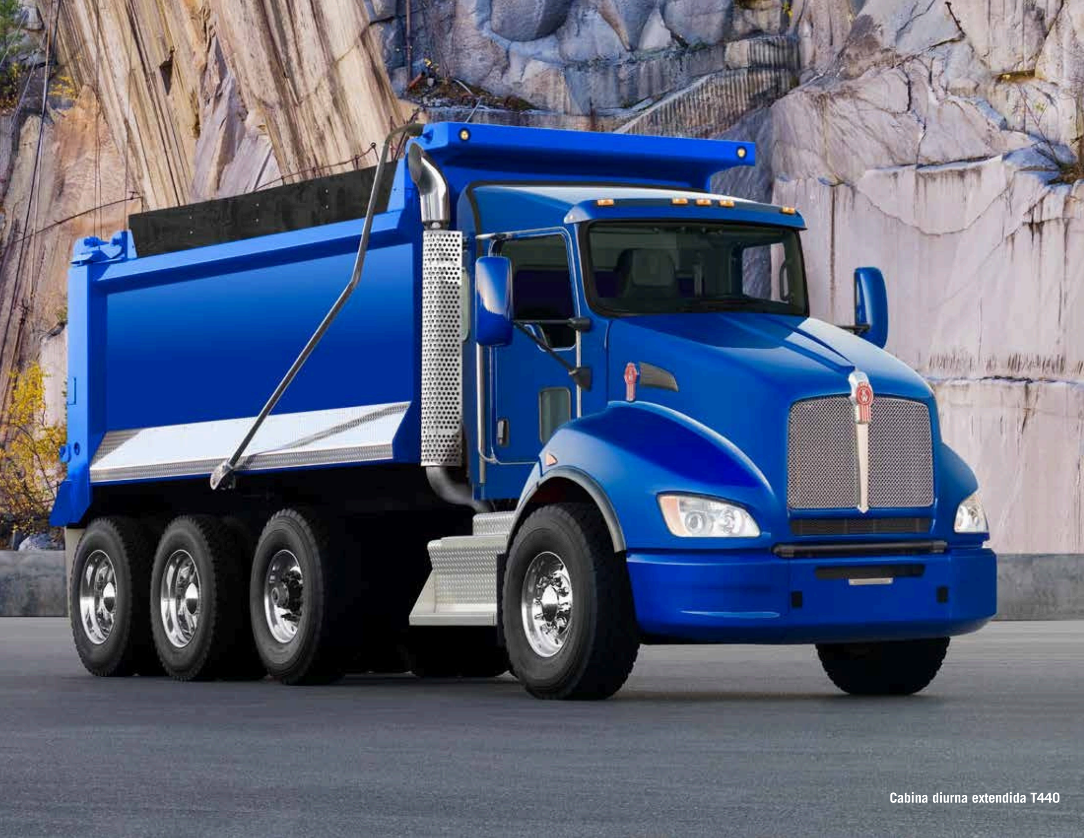
Cabina diurna estendida T440